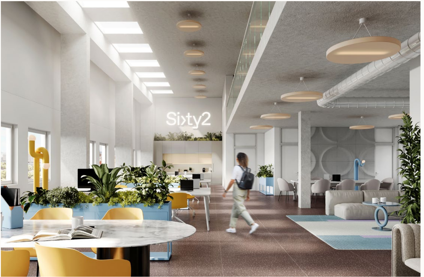
Alle Visualisierungen und die darin dargestellten Einrichtungen sind unverbindlich und dienen Illustrationszwecken.