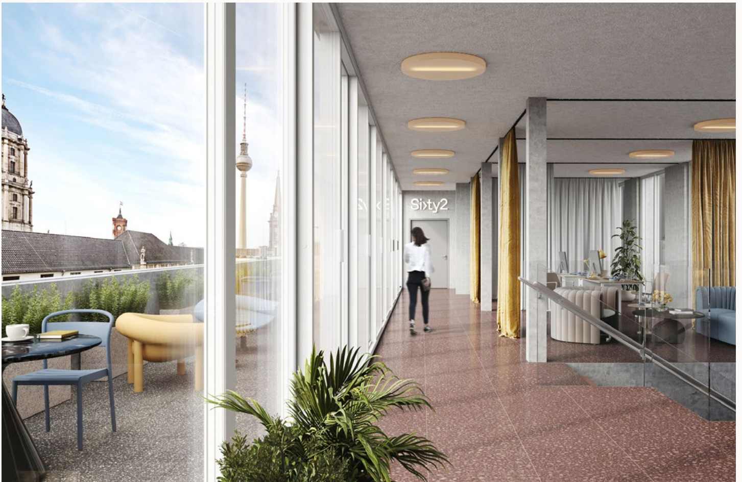
All visualizations and the facilities depicted therein are non-binding and serve illustration purposes only.